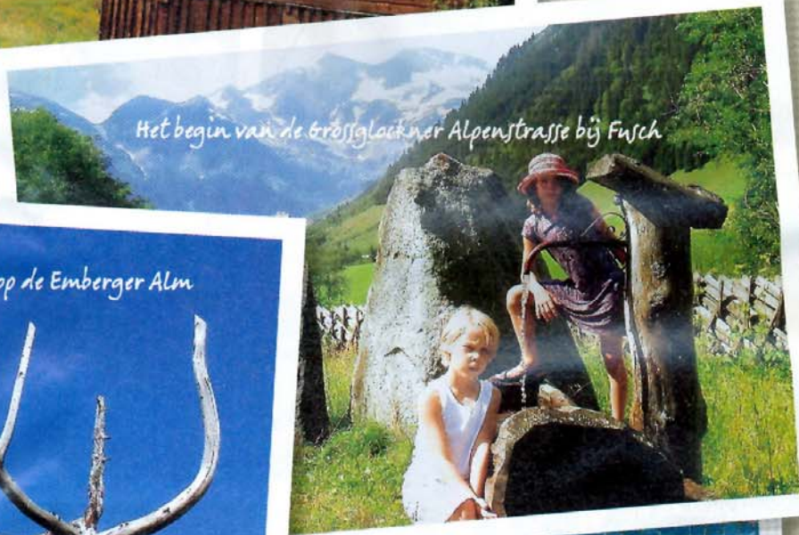
Het begin van de Grössglockner Alpenstrasse bij Fusch