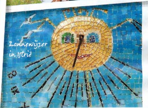
Zonnewijzer in Istrië