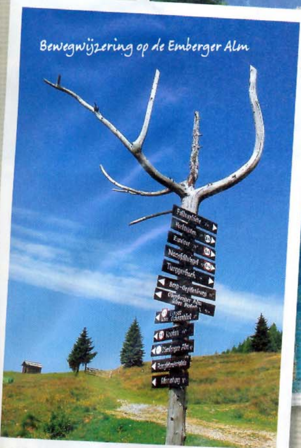
Bewegwijzering op de Emberger Alm